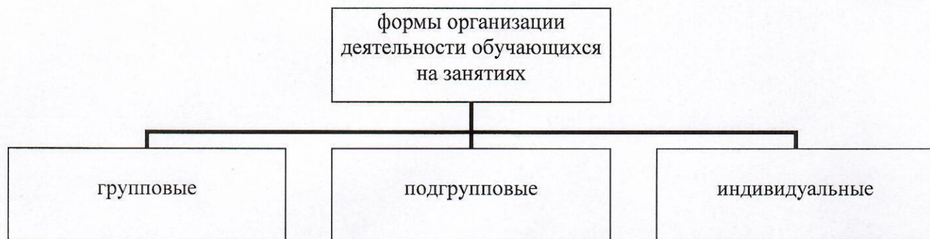
Рис.1. Формы организации деятельности обучающихся на занятиях

Преимущественно используются следующие формы организации деятельности обучающихся на занятиях (рис. 1).