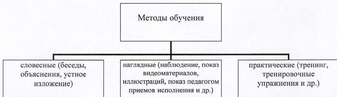
Рис.2. Методы обучения, в основе которых лежит способ организации занятий

Методы обучения, в основе которых лежит способ организации занятий, и приоритетные формы проведения занятий представлены на Рис.2. и Рис.3.