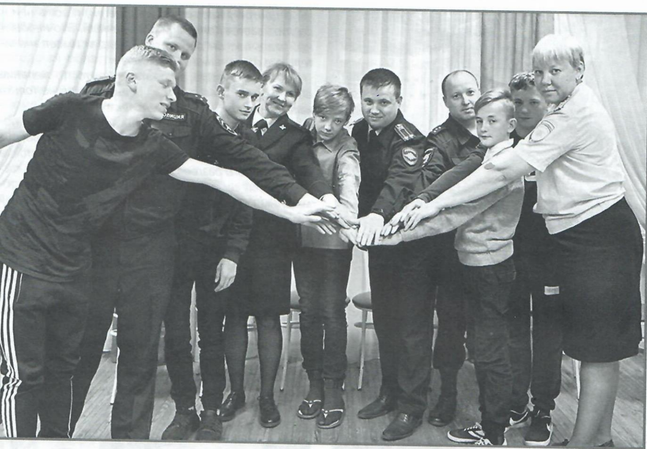
Сотрудники ОМВД и подопечные

встречах и профилактических беседах, а в практическом тесном общении.